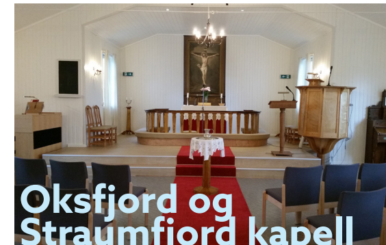
Oksfjord og Straumfjord kapell

3. september, 14. søndag i fastetiden kl 16:00 – Høymesse