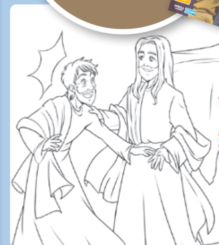
Tegning: Chiara Bertelli